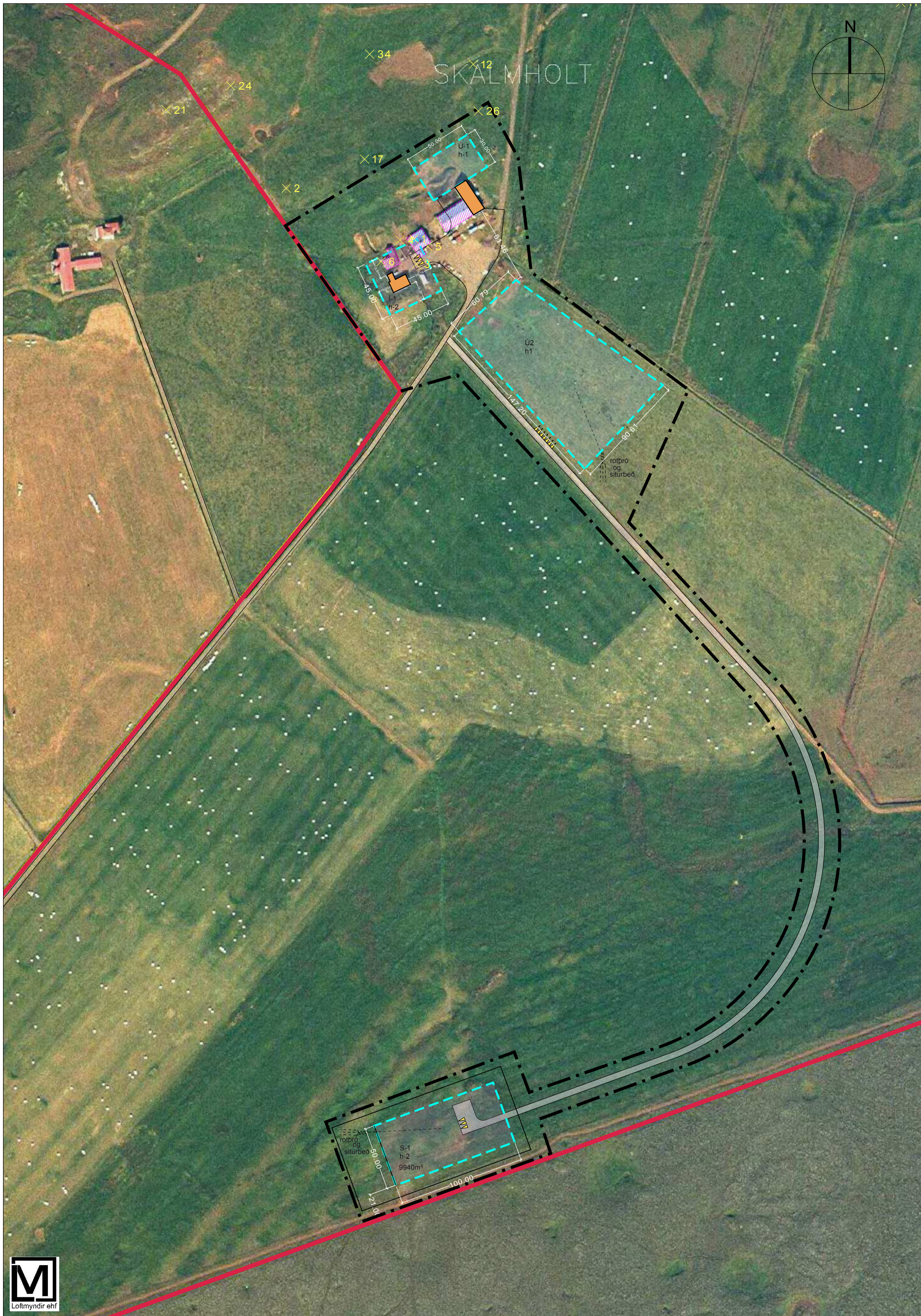
Tillaga að deiliskipulagi, mkv. 1:2000